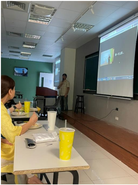
講座：流音系徐O杰老師分享