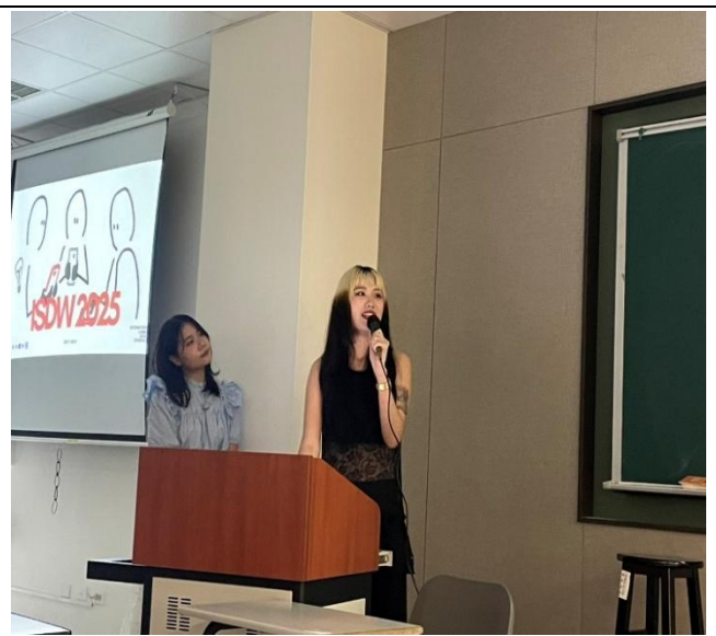
講座：產設系學生分享