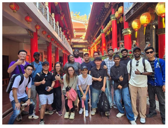
鹿耳門天后宮參訪