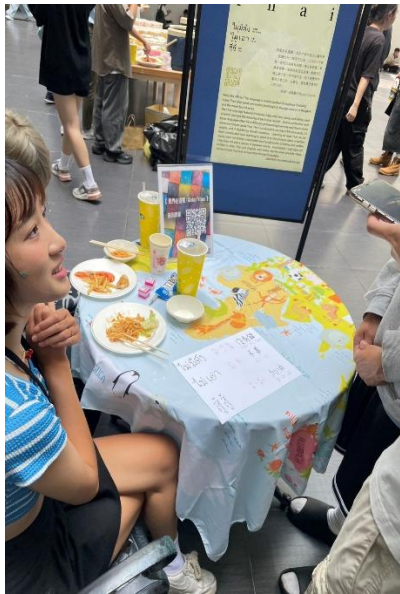
異國語言闖關活動