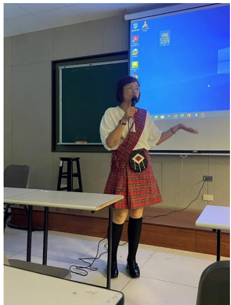
講座：資傳系鄭O怡主任分享