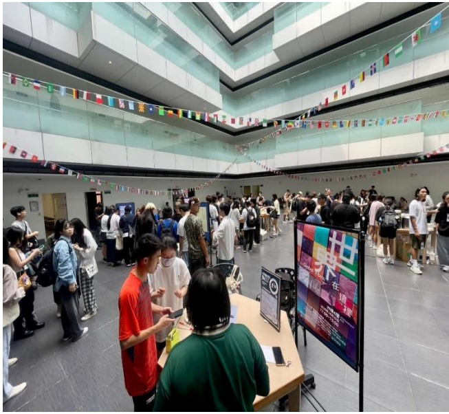
異國語言闖關活動