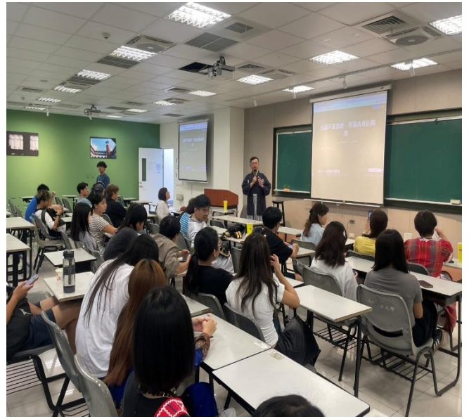
講座分享：院長致詞