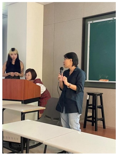
講座：產設系程O鈺主任分享