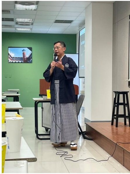
講座分享：院長致詞