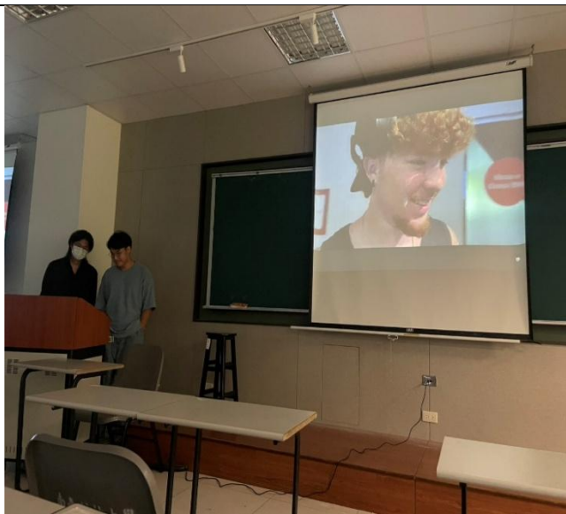
講座：資傳系與多樂系學生分享