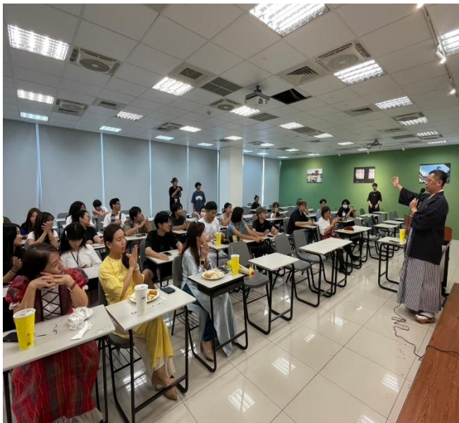
講座分享：院長致詞