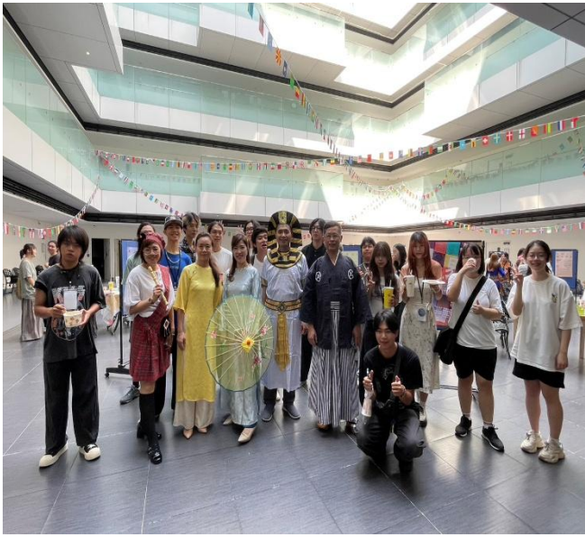
異國服飾展現團照