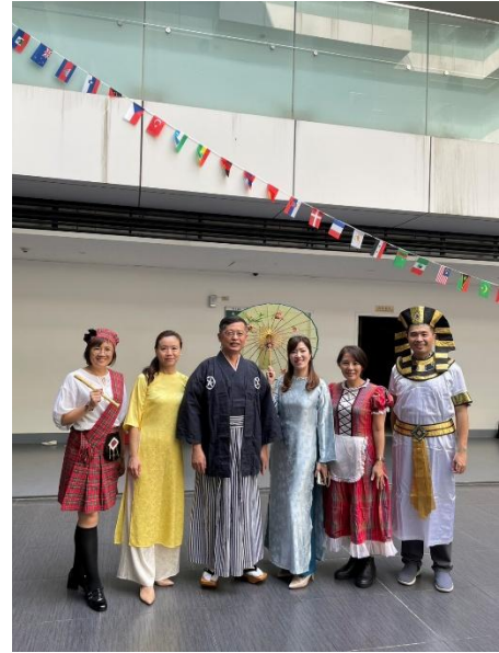
異國服飾展現團照