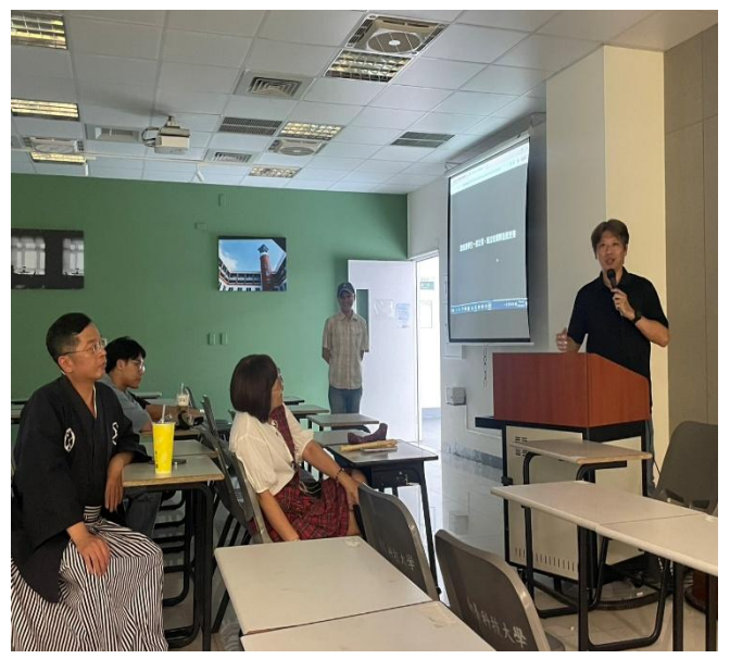
講座：流音系葉O彰老師分享